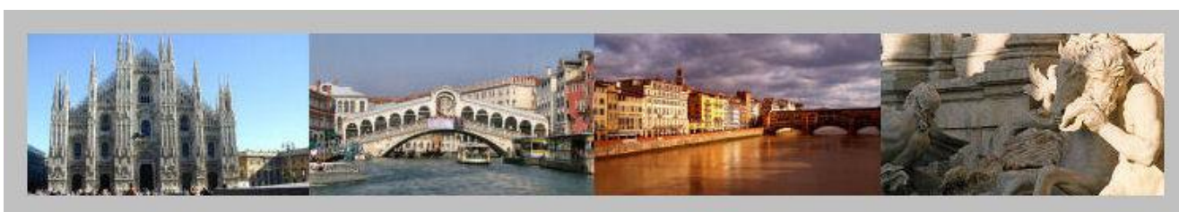
Milano, Venezia, Firenze e Roma