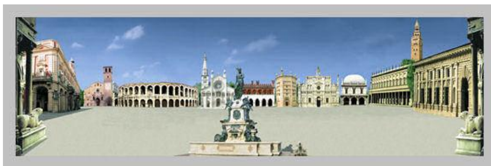
Alessandria, Bologna, Brescia, Cremona, Lodi, Mantova, Modena, Parma, Pavia, Piacenza, Reggio Emilia, Verona